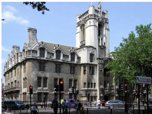
Ұлыбритания Жоғарғы Сотының ғимараты

Дайсидің ойынша, «құқық үстемдігі» терминінің үшінші және мүлдем бөлек, ағылшын институттарының ерекше белгісі болып табылатын мағынасы бар. Бұл мағына ол «құқықтық рухтың өктемдігін» қамтиды. 18 Осы тезистің негізінде автор түбегейлі маңызды тұжырым жасады: «Конституция, конституцияның жалпы қағидаттары (мысалы, жеке бас бостандығы немесе бірлесу бостандығы) сот қарастырған нақты істер бойынша тұлғалардың құқықтарын анықтау үдерісінде қабылданған сот шешімдерінің нәтижесі болып табылатындықтан, конституция құқық үстемдігіне қанық деп пайымдай аламыз». 19 Ал көптеген шетелдік конституцияларға сәйкес, адам құқықтарына берілген кепілдік – конституцияның өзінің жалпы қағидаттарының нәтижесі. 20