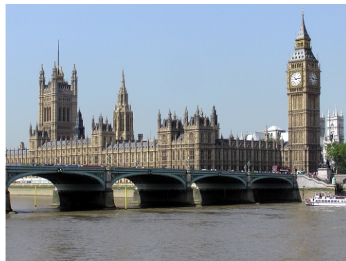
Ұлыбритания Парламентінің ғимараты